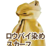
ロウバイ染めスカーフ 2,500円 ※一例です。