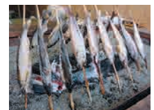
さくら鱈・あゆのいろいろ焼き 各700円