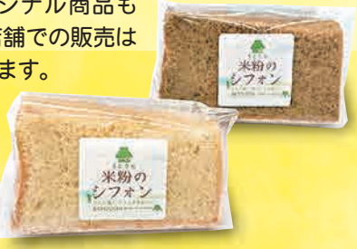
米粉のシフォンケーキ 250~340円(税込)

松田町寄1704-3 10:00~16:00 不定休 1台 バス停「札場」下車、徒歩約2分 0465-87-8315