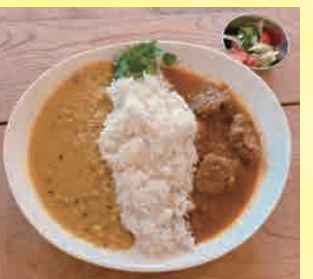
つくばどりと豆のあいかけカレー 1,150円

松田町寄1330-6 12:00~16:00 水、木、金、土、日 ※土、日はロウバイまつり会場にて出店 バス停「田代向」下車、徒歩約2分 3台 080-5403-2896