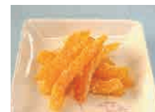
オレンジピール 300円